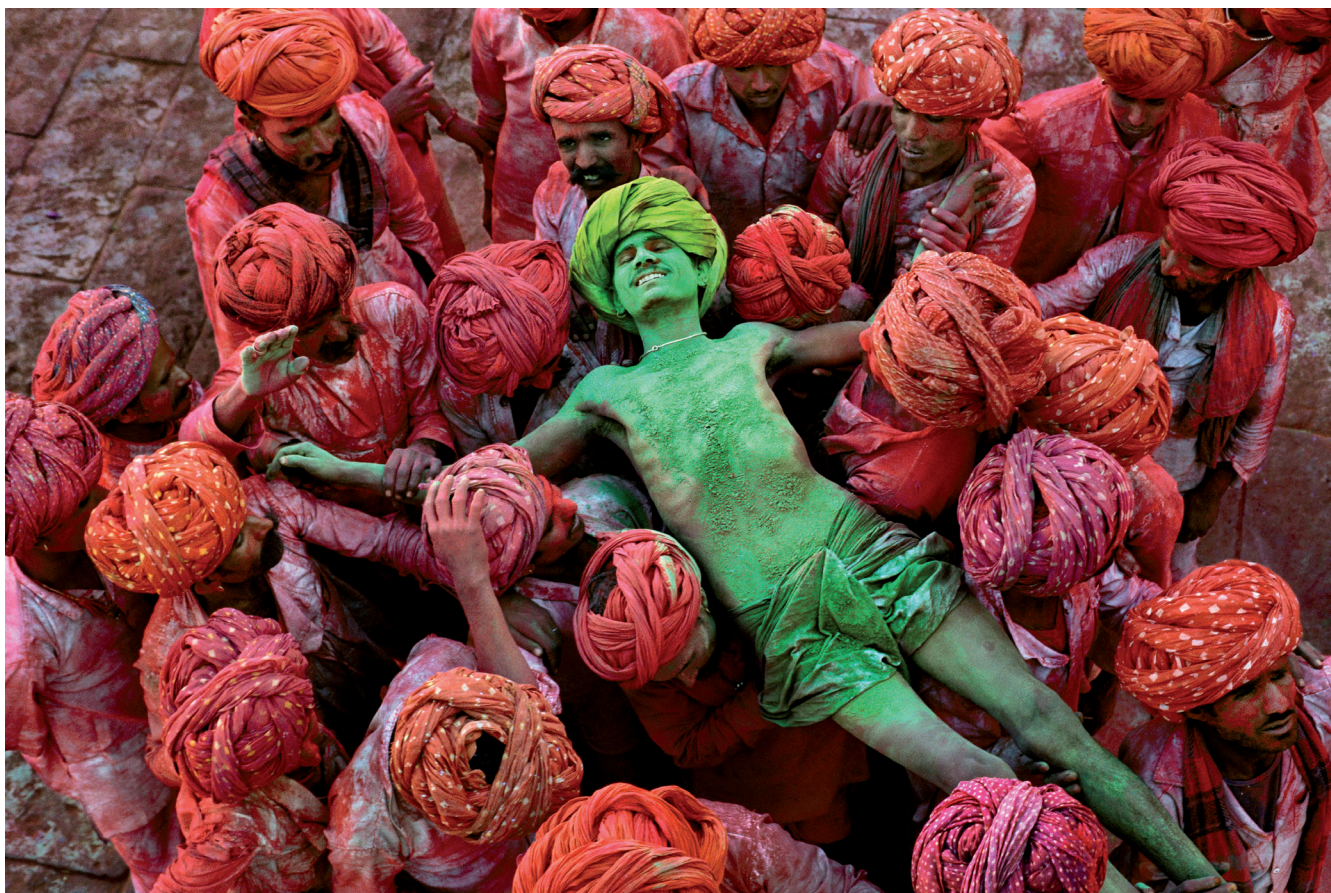
Steve McCurry, Jaipur, Rajasthan, Inde , 1996, 70x100cm, "in partnership with Orion57", Curator Biba Giacchetti