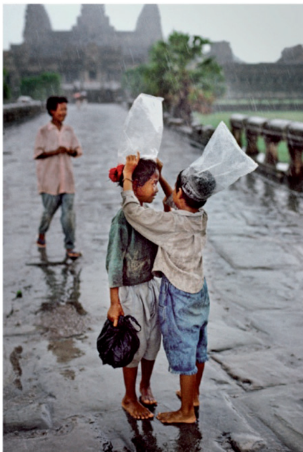
Steve McCurry, Enfants utilisant des sacs en plastique comme parapluies improvisés. Angkor Wat, Cambodge, 1998 © Steve McCurry, "in partnership with Orion57", Curator Biba Giacchetti

L'émotion qui se dégage des portraits et des scènes représentant des enfants chez McCurry évoque la démarche première du photographe, qui est de démontrer l'unité de la condition humaine malgré les différences de cultures et de territoires. Tous les enfants du monde jouent et s'émerveillent de la même manière, quel que soit leur pays d'origine.