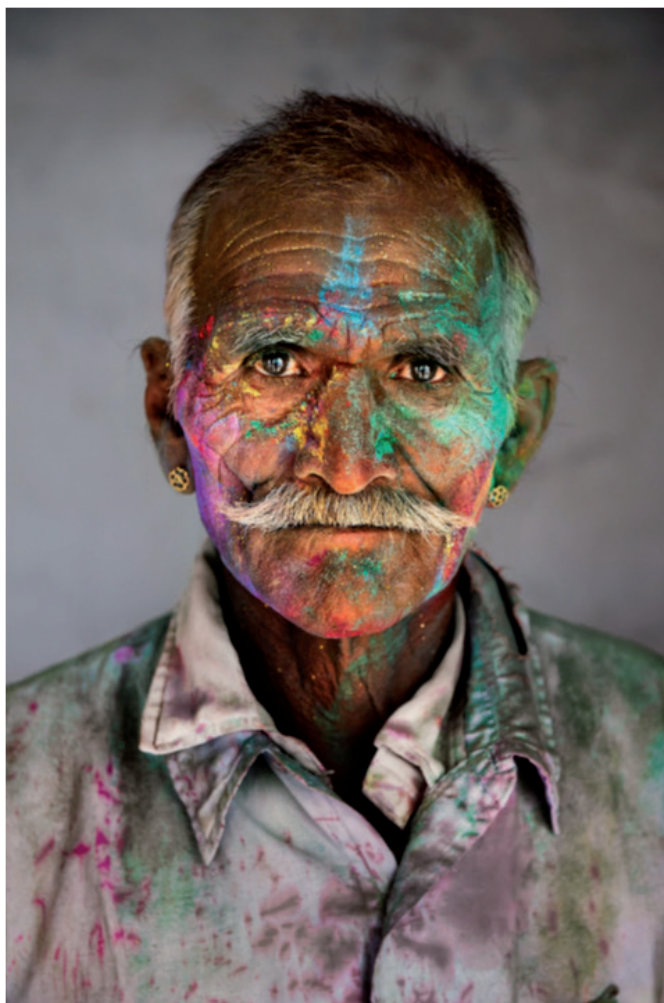
Steve McCurry, Rajasthan , Inde, 2009, 100x70cm © Steve McCurry, "in partnership with Orion57", Curator Biba Giacchetti

Après ce premier reportage en Afghanistan, McCurry fut associé à ce travail sur les conflits armés. Pourtant, cela n'a jamais été son ambition première car il dit ne s'être jamais considéré comme un reporter de guerre. Cependant, sa reconnaissance internationale, et notamment l'Afghane en couverture du National Geographic , lui valut de nombreuses commandes de la part de grands journaux sur les événements de notre monde. En 1986, il devient membre de la célèbre agence de presse Magnum, fondée après les traumatismes de la seconde guerre mondiale, qui compte parmi ses membres des reporters et des artistes photographes. Ses photographies de guerres, de catastrophes naturelles ou de tragédies terroristes sont des témoignages visuels puissants qui nous rappellent la réalité brutale de ces événements, tout en honorant les histoires individuelles des personnes affectées. McCurry a mis plusieurs fois sa vie en danger, a vécu un violent mouvement de foule en Inde et fut arrêté au Pakistan et présumé mort deux fois. Son travail, dans ces contextes extrêmes, révèle non seulement l'horreur et la destruction, mais aussi les moments de courage, de solidarité et de survie humaine.