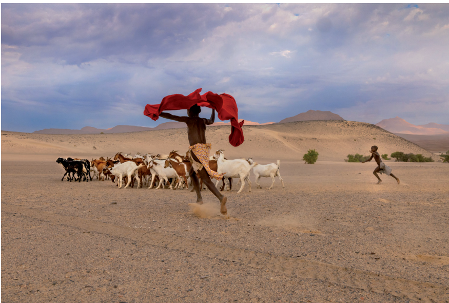
Steve McCurry, Des bergers Himba emmènent leurs chèvres paître , Namibie, 2023 © Steve McCurry, "in partnership with Orion57", Curator Biba Giacchetti

peut prendre quelques minutes ou plusieurs jours. Les regards magnétiques de ces portraits nous plongent dans l'intensité d'un face à face poignant.